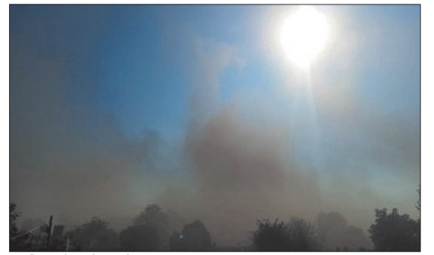
ब्लास्टिंग से उठते धूल के गुबार।