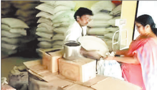
राशन लेती हितग्राही।

खाद्य विभाग के राशन कार्ड हितग्राहियों के 95 हजार सदस्यों का दिसंबर माह से उनके हिस्से में आने वाली खाद्य सामग्री के वितरण पर रोक लगा दी गई है। ऐसे सदस्यों के द्वारा ई-केवायसी नहीं कराए जाने की वजह से शासन स्तर से ही आबंटन पर