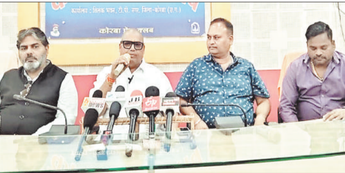
पत्रकारवार्ता में जानकारी देते एसोसिएशन के अध्यक्ष व अन्य।

कुदुरमाल पुल बंद होने के बाद शहर के बीच से गुजर रहे हैं भारी वाहन