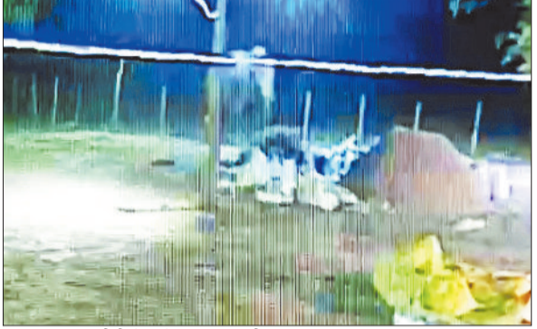
चचिया धान खरीदी केंद्र में मंडरता हाथी।